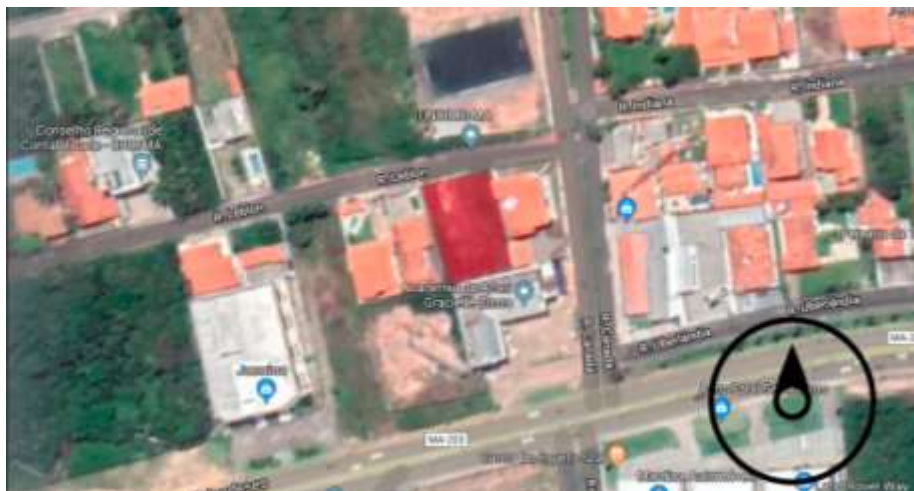
Imagem de satélite: terreno marcado em vermelho